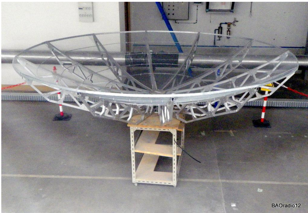
Figure 1 Parabole 3m de RF HAM Design montée au LAL

Le 4/4/12 les personnes présentes se sont réunies au LAL principalement dans le hall « CALVA/Virgo » où est entreposée une parabole de 3m de diamètre commandée en kit à la société RF HAMDesign et montée au LAL (Figure 1).